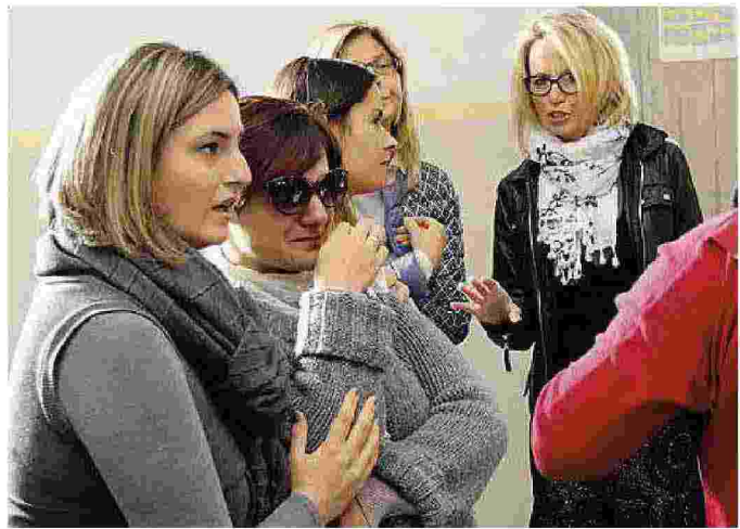
In quattrocento si sono presentati ieri all'istituto Palladio per l'assegnazione delle cattedre per supplenti di un anno alle elementari