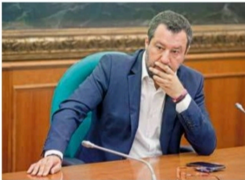
Il premier Draghi e il leader della Lega Salvini