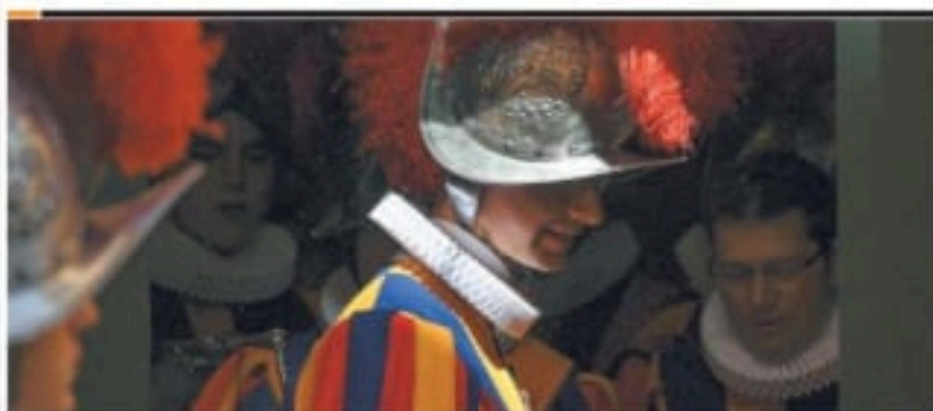
Scatta l'obbligo di immunizzarsi per l'esercito vaticano