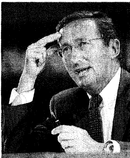
POLEMICO Il leader di An Gianfranco Fini